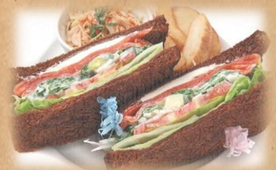
SMOKED SALMON & AVOCADO SALAD